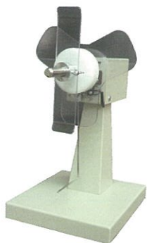
ワインダー UR110Ⅲ スタンドアロン型