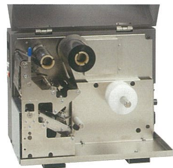
操作が簡単な フルオープンカバー方式を採用